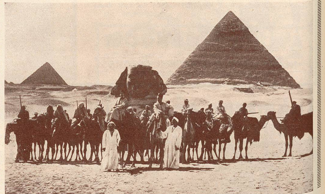
Une scène du Raid en Avion autour du Monde .

Partis de Paris, ils se sont dirigés par Marseille vers l'Égypte, ont traversé la Mer Rouge et l'Océan Indien, touchant aux régions les plus intéressantes des Indes, se transportant ensuite