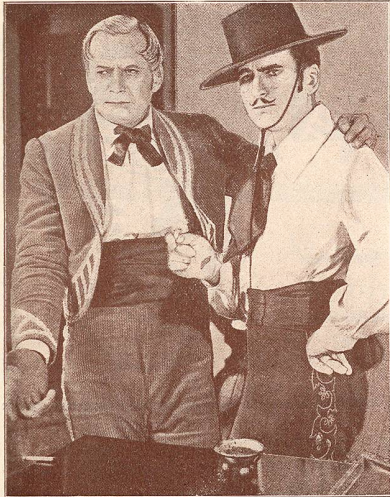
DOUGLAS FAIRBANKS dans Don X Zorro père . Production United Artists.