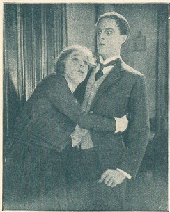
Alfred LUNT et Jobyna HOWLAND Une scène du film Dix Femmes pour un Homme.

Messieurs les loueurs de films sont invités à confier leur publicité à L'ÉCRAN ILLUSTRÉ, paraissant chaque semaine, qui leur fera un prix excessivement réduit. L'ÉCRAN ILLUSTRÉ est envoyé à tous les directeurs de cinéma de toute la Suisse et constitue un moyen de propagande aussi efficace que bon marché. Demandez notre tarif à l'administration du journal, 11, avenue de Beaulieu, à Lausanne.