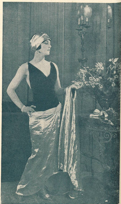
LEATRICE JOY dans LE RÉQUISITOIRE