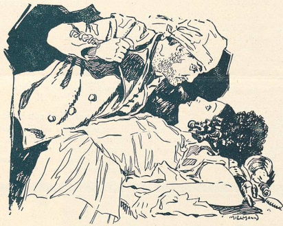
„Amours de Contrebandiers“ qui passe cette semaine au Théâtre Lumen.