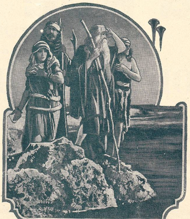
LES DIX COMMANDEMENTS passe au Cinéma du Bourg à Lausanne.

Vous passerez d'agréables soirées à la Maison du Peuple (de Lausanne).