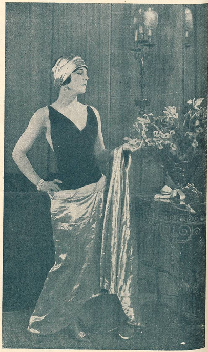
LEATRICE JOY dans LE RÉQUISITOIRE