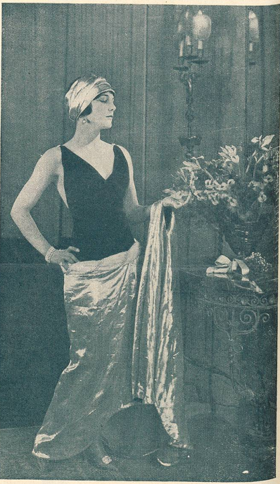
LEATRICE JOY dans LE RÉQUISITOIRE

ACHETEZ notre magnifique ALBUM des 180 Vedettes du Cinéma. Fr. 1.50 net. S'adresser à l'Administration de L'ÉCRAN, 11, Av. de Beaulieu.