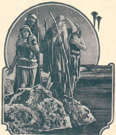
LES DIX COMMANDEMENTS passe au Cinéma du Bourg à Lausanne.

Vous passerez d'agréables soirées à la Maison du Peuple (de Lausanne).