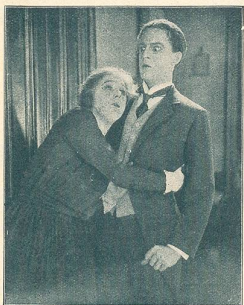
Alfred LUNT et Jobyna HOWLAND Une scène du film Dix Femmes pour un Homme.

Messieurs les loueurs de films sont invités à confier leur publicité à L'ÉCRAN ILLUSTRÉ, paraissant chaque semaine, qui leur fera un prix excessivement réduit. L'ÉCRAN ILLUSTRÉ est envoyé à tous les directeurs de cinéma de toute la Suisse et constitue un moyen de propagande aussi efficace que bon marché. Demandez notre tarif à l'administration du journal, 11, avenue de Beaulieu, à Lausanne.