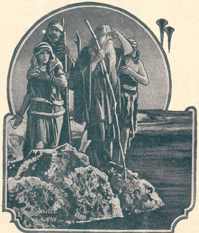
LES DIX COMMANDEMENTS passe au Cinéma du Bourg à Lausanne.

Vous passerez d'agréables soirées à la Maison du Peuple (de Lausanne).