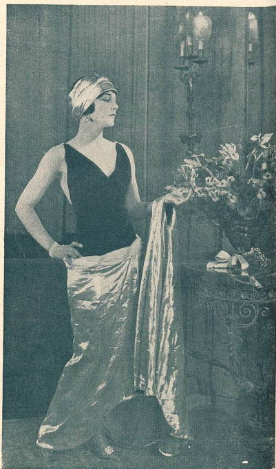
LEATRICE JOY dans LE RÉQUISITOIRE

ACHETEZ notre magnifique ALBUM des 180 Vedettes du Cinéma. Fr. 1.50 net. S'adresser à l'Administration de L'ÉCRAN, 11, Av. de Beaulieu.