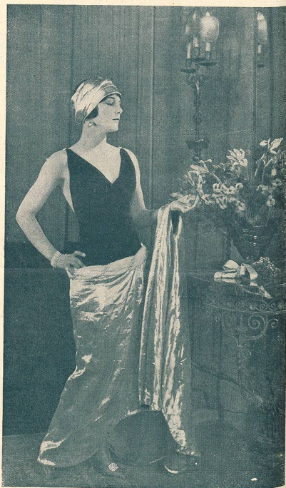
LEATRICE JOY dans LE RÉQUISITOIRE