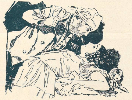
„Amours de Contrebandiers“ qui passe cette semaine au Théâtre Lumen.

Une jeune et riche Argentine Carmelita de Corloba (Pola Negri) doit épouser un non moins riche banquier de Buenos-Ayres. Lors de son voyage à Paris, qu'elle a entrepris pour acheter son trousseau, elle fait la connaissance de deux hommes. L'un très pauvre, Dudley Drake (Jack Holt), l'autre très riche et de plus, prince indien, Rao Singh (Charles de Rochefort). Elle s'éprend de l'homme pauvre et l'épouse immédiatement à l'américaine, mais le ménage ne tarde pas à lutter contre la misère. Le prince qui quette sa proie apprend que Carmelita, devenue Mme Drake a dépensé l'argent que des dames patronnesses lui ont confié pour une œuvre charitable, à titre de trésorière. Rao Singh lui offre d'acquiescer sa dette. Lorsque Carmelita veut rendre l'argent au prince celui-ci refuse et exige ce que vous pensez. Carmelita blesse le prince d'un coup de feu. L'affaire passe devant la Cour, où l'honnête Carmelita raconte toute la vérité. C'est un film Paramount.