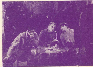
Les Deux Gosses