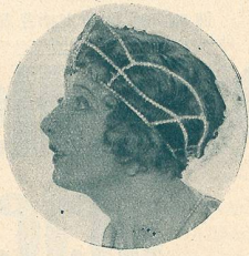
BETTY BLYTHE dans „Pour un Collier de Perles“.

Vous n'en saurez pas davantage pour aujourd'hui, vous ne saurez qu'en voyant le film s'il se termine en gaieté ou en tristesse. (Mon Ciné.)