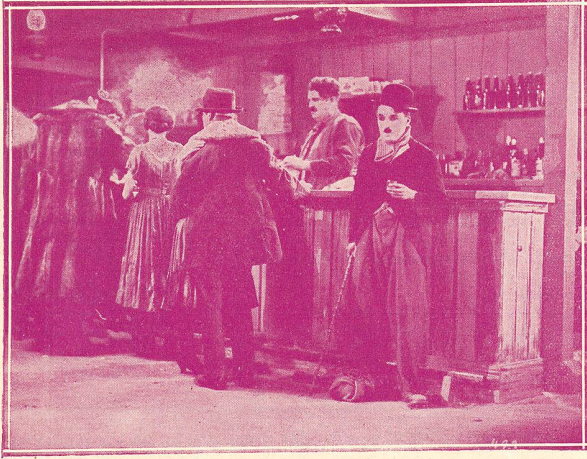
Une des principales scènes de LA FIÈVRE DE L'OR avec Charlie Chaplin.