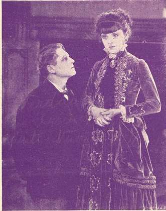
MON GRAND (Mater Dolorosa)

VOTRE PUBLIC SERA EMBALLÉ PAR L'INTERPRÉTATION DE