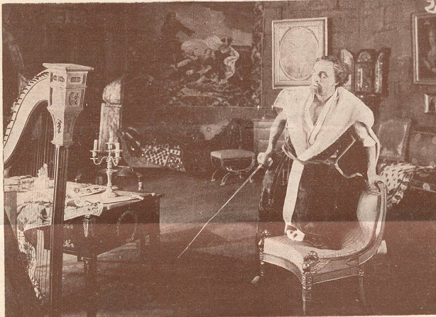
Une scène du film Le Comte Kostia .

la belle artiste écossaise qui joue pour la Fox Film et que nous avons admirée dans Hors du Gouffre .