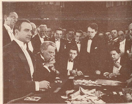
Une scène du film Le Double Amour qui passe cette semaine au CINÉMA-PALACE à Lausanne, avec Jean Angelo à gauche de l'image.

le célèbre acteur allemand que nous verrons cette semaine au THEATRE LUMEN dans le rôle du Comte Kostia .