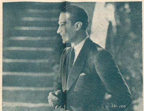
Une scène du film L'Hacienda Rouge.

Nous voyons dans ce film le beau, irrésistible Valentino, la coqueluche du sexe faible ; il a comme partenaire féminin Nita Naldi. L'action se passe dans l'Amérique du Sud. Un noble espagnol a jadis fiancé son fils, le brillant Alonso, à une jeune fille d'un ami de Madrid. Le mariage doit avoir lieu, mais la fille du majordome, du marquis, qui est amoureuse de Alonso, en conçoit un sauvage dépit. La nuit du mariage, elle fait enlever la fiancée d'Alonso par un brigand des pampas. Alonso n'a qu'un désir, c'est de reprendre sa fiancée au Tigre, c'est ainsi qu'on nomme le brigand ravisseur, mais, par un subterfuge de Carlotta, la fille du majordome, Alonso croit que sa fiancée est tombée amoureuse du Tigre ; de désespoir il s'enfuit et nous le retrouvons dans un café à matelots d'un port sud-américain. Un soir, on signale à Alonso la présence du Tigre dans un bar du port ; il s'y rend et un ami zélé d'Alonso étrangle le brigand. Carlotta, qui se trouve aussi là, tombée au dernier rang de la dégradation, apprend à Alonso que sa fiancée n'a jamais cessé de l'aimer mais que le Tigre connaissait seul le refuge de Juliette et que sa mort a anéanti le secret. Cependant Alonso finit par retrouver sa fiancée dans un couvent où elle était sur le point de prononcer les grands vœux éternels, car elle croyait qu'Alonso était mort. On devine la conclusion.