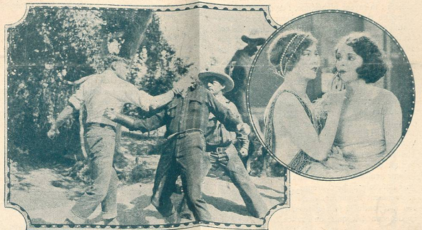
Une scène du film Le Gagnant prend Tout. Une remarquable production de la Fox Film.

Ce film tiré par Jean Epstein de la nouvelle d'Alphonse Daudet déborde de sentiment, un de ces amours d'enfants qui font mourir. Un enfant adopté à vécu heureux, sur La Belle Nivernaise , une barque de canal, goûtant à toutes les joies de la liberté et de la douce affection. Une compagnie de jeux et de travaux éclaira sa jeunesse. Mais son père le retrouve, le reprend, le retire à son bonheur. Il le met au Collège. L'enfant s'ennuie, souffre, pense au chaland perdu, à la sœur de son cœur, à son tendre amour. Il tombe malade, il va mourir. Sa famille adoptive vient le voir au chevet de son lit blanc d'infirmerie. Son père le rend à ceux qui seuls ont pu faire son bonheur. La trame est simple, aussi simple, aussi ingénue de ce sentiment juvénile. C'est du bon cinéma populaire qui attendrit et qui plaît. La Maison du Peuple ne pouvant mieux choisir son programme qui est complété par une comédie amusante, Deuxes carresses et une très belle revue encyclopédique Pathé, toujours instructive.