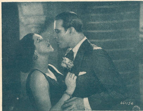
Une scène du film L'Hacienda Rouge.

avec RUDOLF VALENTINO passe cette semaine au Modern - Cinéma à Lausanne.