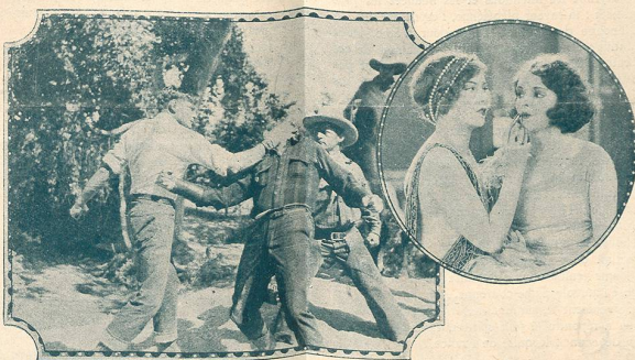
Une scène du film Le Gagnant prend Tout. Une remarquable production de la Fox Film.

Ce film tiré par Jean Epstein de la nouvelle d'Alphonse Daudet déborde de sentiment, un de ces amours d'enfants qui font mourir. Un enfant adopté à vécu heureux, sur La Belle Nivernaise , une barque de canal, goûtant à toutes les joies de la liberté et de la douce affection. Une compagnie de jeux et de travaux éclaira sa jeunesse. Mais son père le retrouve, le reprend, le retire à son bonheur. Il le met au Collège. L'enfant s'ennuie, souffre, pense au chaland perdu, à la sœur de son cœur, à son tendre amour. Il tombe malade, il va mourir. Sa famille adoptive vient le voir au chevet de son lit blanc d'infirmerie. Son père le rend à ceux qui seuls ont pu faire son bonheur. La trame est simple, aussi simple, aussi ingénue de ce sentiment juvénile. C'est du bon cinéma populaire qui attendrit et qui plaît. La Maison du Peuple ne pouvant mieux choisir son programme qui est complété par une comédie amusante, Deuxes carresses et une très belle revue encyclopédique Pathé, toujours instructive.