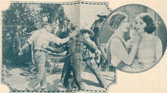
Une scène du film Le Gagnant prend Tout. Une remarquable production de la Fox Film.

Ce film tiré par Jean Epstein de la nouvelle d'Alphonse Daudet déborde de sentiment, un de ces amours d'enfants qui font mourir. Un enfant adopté à vécu heureux, sur La Belle Nivernaise , une barque de canal, goûtant à toutes les joies de la liberté et de la douce affection. Une compagnie de jeux et de travaux éclaira sa jeunesse. Mais son père le retrouve, le reprend, le retire à son bonheur. Il le met au Collège. L'enfant s'ennuie, souffre, pense au chaland perdu, à la sœur de son cœur, à son tendre amour. Il tombe malade, il va mourir. Sa famille adoptive vient le voir au chevet de son lit blanc d'infirmerie. Son père le rend à ceux qui seuls ont pu faire son bonheur. La trame est simple, aussi simple, aussi ingénue de ce sentiment juvénile. C'est du bon cinéma populaire qui attendrit et qui plaît. La Maison du Peuple ne pouvant mieux choisir son programme qui est complété par une comédie amusante, Deuxes carresses et une très belle revue encyclopédique Pathé, toujours instructive.