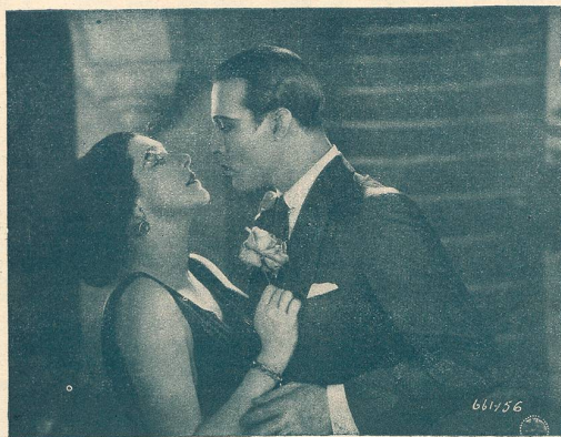
Une scène du film L'Hacienda Rouge.

avec RUDOLF VALENTINO passe cette semaine au Modern - Cinéma à Lausanne.