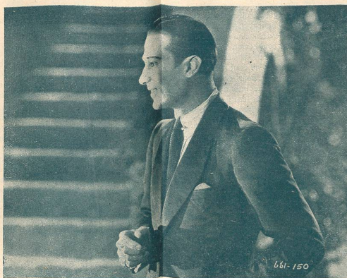
Une scène du film L'Hacienda Rouge.

Nous voyons dans ce film le beau, irrésistible Valentino, la coqueluche du sexe faible ; il a comme partenaire féminin Nita Naldi. L'action se passe dans l'Amérique du Sud. Un noble espagnol a jadis fiancé son fils, le brillant Alonso, à une jeune fille d'un ami de Madrid. Le mariage doit avoir lieu, mais la fille du majordome, du marquis, qui est amoureuse de Alonso, en conçoit un sauvage dépit. La nuit du mariage, elle fait enlever la fiancée d'Alonso par un brigand des pampas. Alonso n'a qu'un désir, c'est de reprendre sa fiancée au Tigre, c'est ainsi qu'on nomme le brigand ravisseur, mais, par un subterfuge de Carlotta, la fille du majordome, Alonso croit que sa fiancée est tombée amoureuse du Tigre ; de désespoir il s'enfuit et nous le retrouvons dans un café à matelots d'un port sud-américain. Un soir, on signale à Alonso la présence du Tigre dans un bar du port ; il s'y rend et un ami zélé d'Alonso étrangle le brigand. Carlotta, qui se trouve aussi là, tombée au dernier rang de la dégradation, apprend à Alonso que sa fiancée n'a jamais cessé de l'aimer mais que le Tigre connaissait seul le refuge de Juliette et que sa mort a anéanti le secret. Cependant Alonso finit par retrouver sa fiancée dans un couvent où elle était sur le point de prononcer les grands vœux éternels, car elle croyait qu'Alonso était mort. On devine la conclusion.