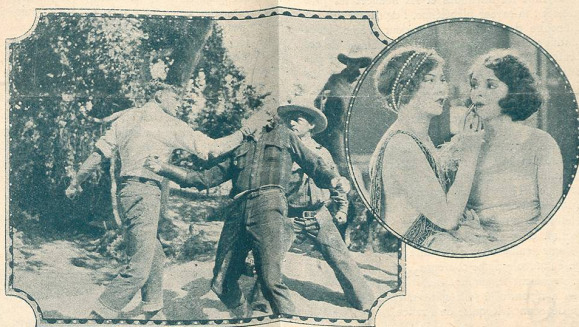
Une scène du film Le Gagnant prend Tout . Une remarquable production de la Fox Film.