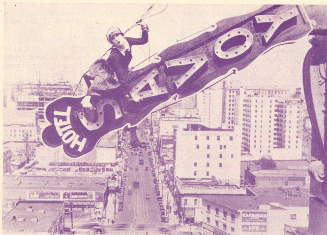
(Dorothy DEVORE) Une des scènes angoissantes de HOLD YOUR BREATH

Ce soir-là, Larouque, tout à ses soucis matériels, tarda longtemps à rentrer auprès de sa chère femme Henriette et de sa fille Suzanne. L'heure du dîner était passée depuis longtemps ; la mère et la fille attendaient à la véranda lorsqu'elles virent les fenêtres de Larouette s'éclairer