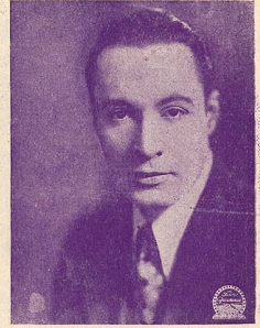
R. LA ROCQUE. une vedette de la Paramount