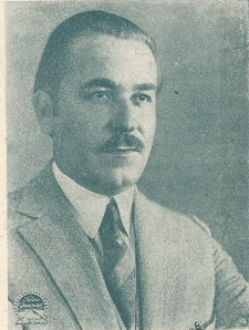
NOAH BEERY une vedette de la Paramount