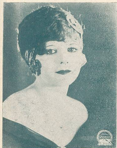
V. REYNOLDS une vedette de la Paramount