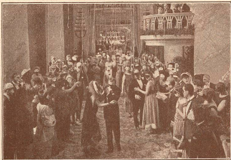
Deux scènes principales du LION DES MOGOLS avec Ivan Mosjoukine.