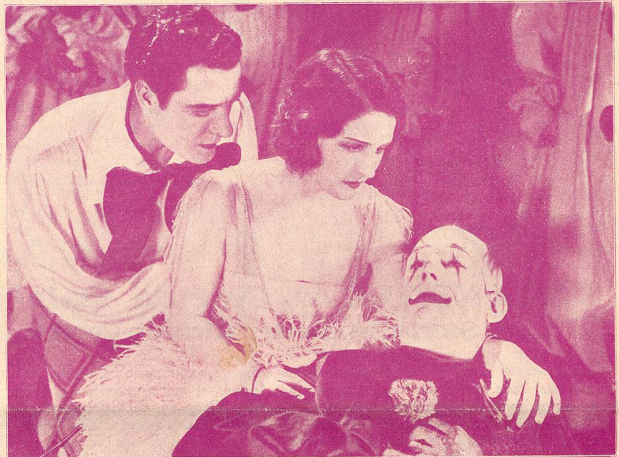
La mort du Clown (Lon Chaney).

Voici en quelques mots l'histoire que nous allons voir à l'écran : Un savant abandonné par sa femme et spolié par un rival sans scrupule est devenu clown dans un cirque de province. Il est l'Homme qui reçoit des gifles (c'est sous ce titre que ce film passe en Amérique). Il s'prend d'une jeune écuillère que son père, un noble taré, veut marier, ou plutôt veut vendre, à celui qui l'a dépouillé (encore une victime aristocratique pour apaiser le Moloch de la démocratie). Mais la jeune fille ne le prend pas au sérieux (le clown et non le dieu qui mange du noble). Cependant le clown veut assurer le bonheur de celle qu'il