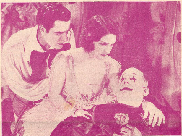
La mort du Clown (Lon Chaney).

Voici en quelques mots l'histoire que nous allons voir à l'écran : Un savant abandonné par sa femme et spolié par un rival sans scrupule est devenu clown dans un cirque de province. Il est l'Homme qui reçoit des gifles (c'est sous ce titre que ce film passe en Amérique). Il s'prend d'une jeune écuillère que son père, un noble taré, veut marier, ou plutôt veut vendre, à celui qui l'a dépouillé (encore une victime aristocratique pour apaiser le Moloch de la démocratie). Mais la jeune fille ne le prend pas au sérieux (le clown et non le dieu qui mange du noble). Cependant le clown veut assurer le bonheur de celle qu'il