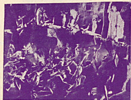
Une scène des saisissantes visions de Dante dans le grand film L'Enfer du Dante . Cliché Fox Film.

Une photo inédite du célèbre singe Bib des Impérial Comédies de Fox Film qui stupéfie les foules par son jeu extraordinaire dans le film Darwin avait raison . Cliché Fox Film.