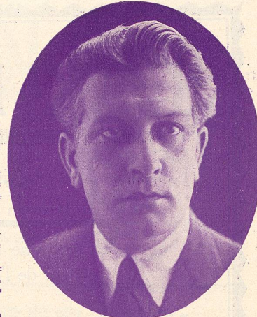
LÉON MATHOT „L'Ami-Fritz“

FILM LA FIÈVRE DE L'OR avec CHARLOT sorti au Strand Théâtre. Succès extraordinaire, immense, battant tous les records New-York, même ceux du Capitole dont le succès plus grand que Stand. Plus de quarante mille personnes en trois jours.