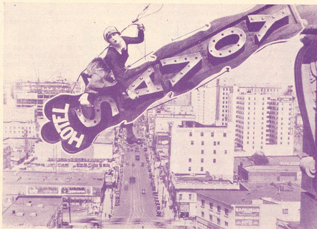
(Dorothy DEVORE) Une des scènes angoissantes de HOLD YOUR BREATH

Ce soir-là, Larouque, tout à ses soucis matériels, tarda longtemps à rentrer auprès de sa chère femme Henriette et de sa fille Suzanne. L'heure du dîner était passée depuis longtemps ; la mère et la fille attendaient à la véranda lorsqu'elles virent les fenêtres de Larouette s'éclairer