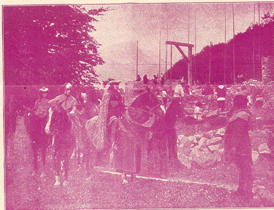
La Construction de la Prison

Il faut admirer les résultats auxquels on est arrivé avec un minimum d'acteurs professionnels.