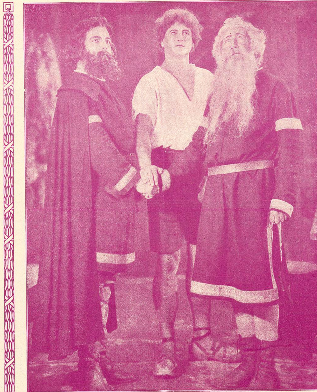
LE SERMENT DES TROIS SUISSES

Dans cette œuvre, qui repose de tant de niaiseries et d'outrances, on voit passer comme les strophes d'un poème pastoral, les scènes classiques des premiers temps de la Confédération : la place d'Altdorf et sa vie rurale, les exactions des baillis, les premiers signes de la révolte populaire, les épisodes de Tell et de Gessler, Stauffacher outragé devant sa maison, Melchthal, fuyant la vengeance des tyrans, Furst dans sa demeure patriarcale, les conciliabules qui précèdent la première alliance, l'expulsion des baillis et enfin, la bataille de Morgarten, qui est la finale de l'œuvre.