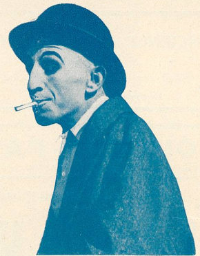
ZIGOTO est au Modern-Cinéma

C'est grâce à cette absence de préjugés que Cecil B. de Mille a découvert Bebe Daniels, Agnès Ayres, Béatrice Swanson, et qu'aujourd'hui cet astronome du ciel pelliculaire vient de découvrir une nouvelle étoile, une blonde Anglaise, Lillian Rich. Espérons que les rayons de ce nouvel astre nous parviendront plus vite que ceux d'Aldébaran. La Bobine.