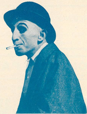
ZIGOTO est au Modern-Cinéma

C'est grâce à cette absence de préjugés que Cecil B. de Mille a découvert Bebe Daniels, Agnès Ayres, Béatrice Swanson, et qu'aujourd'hui cet astronome du ciel pelliculaire vient de découvrir une nouvelle étoile, une blonde Anglaise, Lillian Rich. Espérons que les rayons de ce nouvel astre nous parviendront plus vite que ceux d'Aldébaran. La Bobine.