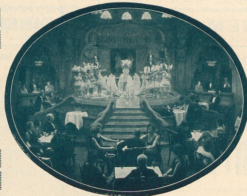
Une autre scène du film UN RÊVE DE BONHEUR.