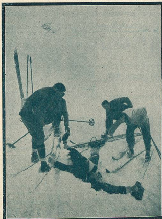
Une scène du film UN RÊVE DE BONHEUR.