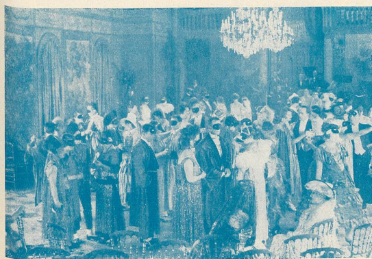
Le Réveil de Maddalone

Depuis lors il a tourné Blanchette , d'après Brieux, par René Hervil. En 1921,