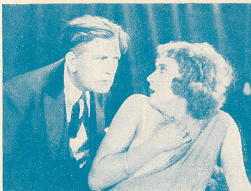
Une scène du Réveil de Maddalone avec Léon Mathot dans le rôle de Ruggiero.