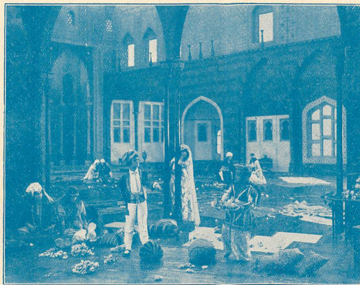
La Femme de l'Orient.