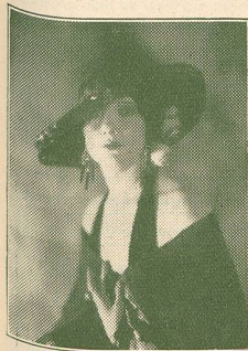
BETTY BLYTHE principale protagoniste de La Chute de l'Idole.