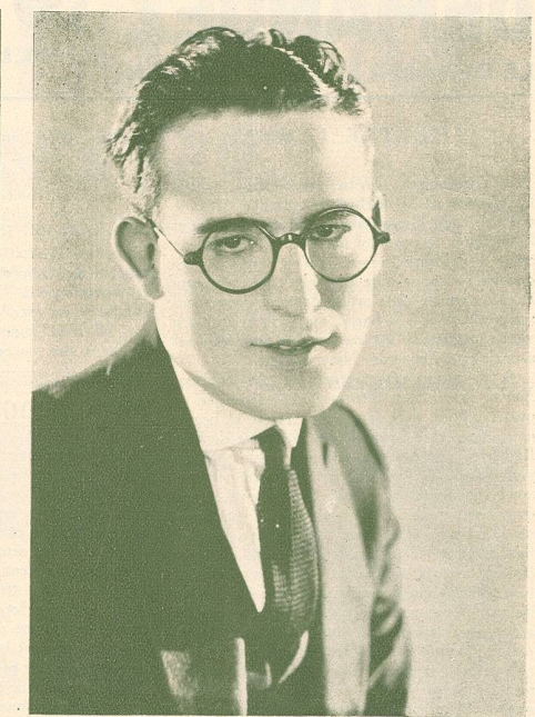
Les Feux follets de l'Abîme.

Harold Lloyd est né à Denver, dans l'Etat de Nebraska, au nord des Etats-Unis, en 1893.