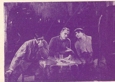
Les Deux Gosses