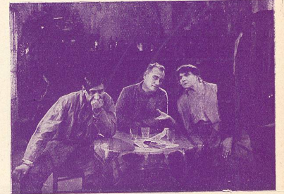
Les Deux Gosses