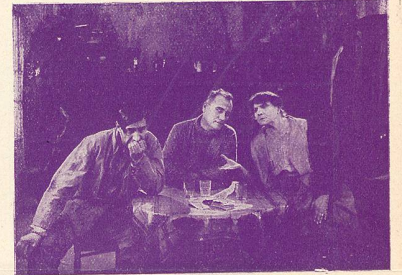
Les Deux Gosses