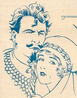
Milton SILLS et Enid BENNETT