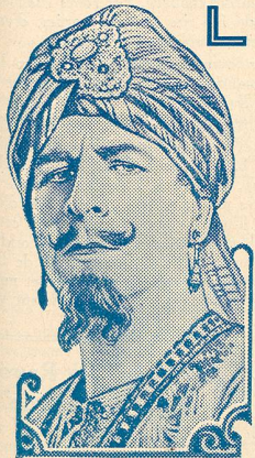
Milton Sills in "The Sea Hawk"

Enid BENNETT :: Milton SILLS :: Wallace BEERY, etc.,