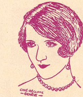
CONSTANCE TALMADGE au Lumen dans Sa Sœur de Paris

Il est bien certain que, comme instrument de recherches techniques et professionnelles et surtout comme moyen de démonstration et de propagande commerciales, le film apporte au monde des producteurs et des vendeurs des ressources insoupçonnées.