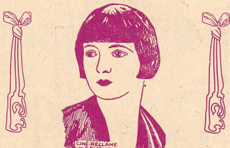
LYA DE PUTTI