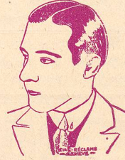
RUDOLPH VALENTINO au Ciné du Bourg dans Les Arènes Sanglantes