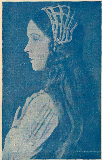
LILIAN GISH dans "ROMOLA"

LILIAN GISH la créatrice si applaudie de The White Sister (Sœur Blanche) et de Romola va bientôt remporter un immense succès dans le rôle de "Mimi" de la Vie de Bohème , aux côtés de John Gilbert, interprète du rôle de "Rodolphe". Cette adaptation cinématographique du chef-d'œuvre d'Henri Murger, a été mise en scène par King Vidor.