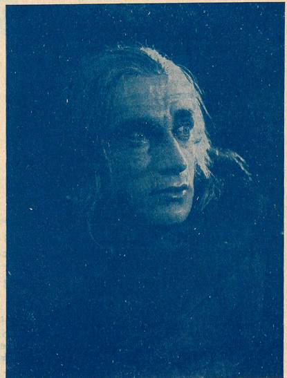
CONRAD VEIDT, le grand acteur allemand, que nous allons voir prochainement dans un double rôle des "Frères Schellenberg".