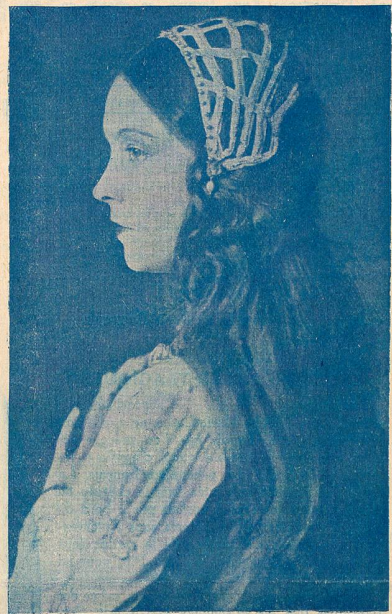
LILIAN GISH dans "ROMOLA"

LILIAN GISH la créatrice si applaudie de The White Sister (Sœur Blanche) et de Romola va bientôt remporter un immense succès dans le rôle de "Mimi" de la Vie de Bohème , aux côtés de John Gilbert, interprète du rôle de "Rodolphe". Cette adaptation cinématographique du chef-d'œuvre d'Henri Murger, a été mise en scène par King Vidor.