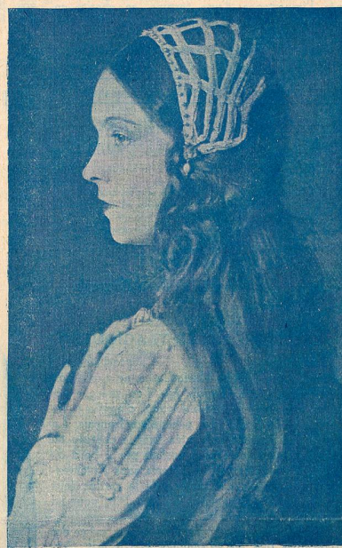
LILIAN GISH dans "ROMOLA"

LILIAN GISH la créatrice si applaudie de The White Sister (Sœur Blanche) et de Romola va bientôt remporter un immense succès dans le rôle de "Mimi" de la Vie de Bohème , aux côtés de John Gilbert, interprète du rôle de "Rodolphe". Cette adaptation cinématographique du chef-d'œuvre d'Henri Murger, a été mise en scène par King Vidor.