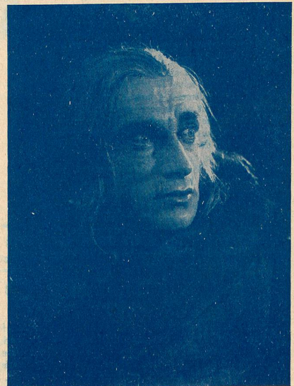
CONRAD VEIDT, le grand acteur allemand, que nous allons voir prochainement dans un double rôle des "Frères Schellenberg".