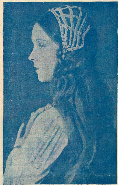
LILIAN GISH dans "ROMOLA"

LILIAN GISH la créatrice si applaudie de The White Sister (Sœur Blanche) et de Romola va bientôt remporter un immense succès dans le rôle de "Mimi" de la Vie de Bohème , aux côtés de John Gilbert, interprète du rôle de "Rodolphe". Cette adaptation cinématographique du chef-d'œuvre d'Henri Murger, a été mise en scène par King Vidor.