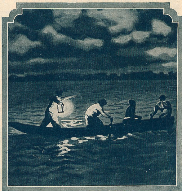
La Mort d'Ourrias, bouvier de Camargue (Mireille)

L'intrigue est ainsi, tout ensemble pittoresque et poignante, tendre et terrible, d'un intérêt qui ne faiblit à aucun moment. Il faudrait presque tout citer. L'âpreté des sites dans la montagne, si bien en harmonie avec le sujet ; la lutte de Carrasco et d'un ancien bandit pour la délivrance de Ramon, sont des merveilles de réalisation.