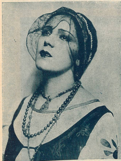
La belle actrice