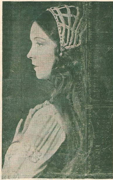
LILIAN GISH dans « Romola »