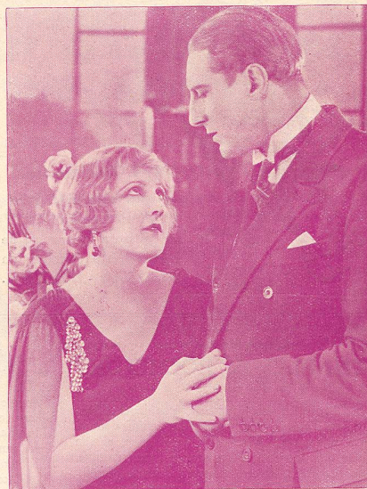
Huguette Duflos et Charles de Rochefort dans La Princesse aux Clowns