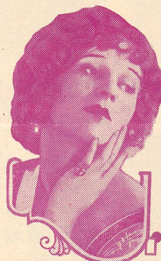
MARGUERITE DE LA MOTTE

Dans Les Dix Commandements , que nous venons de voir, il crée l'imposante figure de Ramsès II.