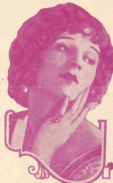
MARGUERITE DE LA MOTTE

Dans Les Dix Commandements , que nous venons de voir, il crée l'imposante figure de Ramsès II.