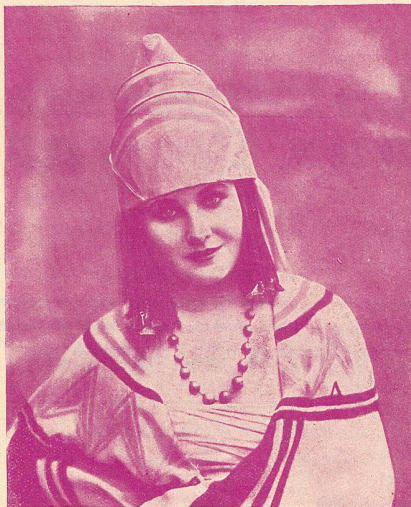
MARIA CORDA l'inoubliable interprète de L'Esclave Reine

SI VOUS VOULEZ COMBATTRE LES DÉSASTREUX EFFETS DE LA MORTE SAISON PASSEZ SANS HÉSITER