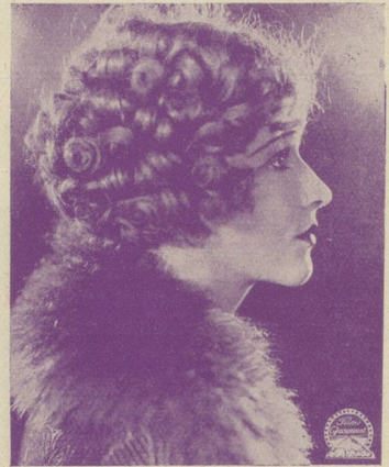
ANNA Q. NILSON au Colisée dans L'Argent ne fait pas le bonheur .

beau Danube bleu , ce film enchanteur qui peut être considéré comme le plus gros succès de la saison.