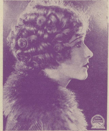
ANNA Q. NILSON au Colisée dans L'Argent ne fait pas le bonheur .

beau Danube bleu , ce film enchanteur qui peut être considéré comme le plus gros succès de la saison.